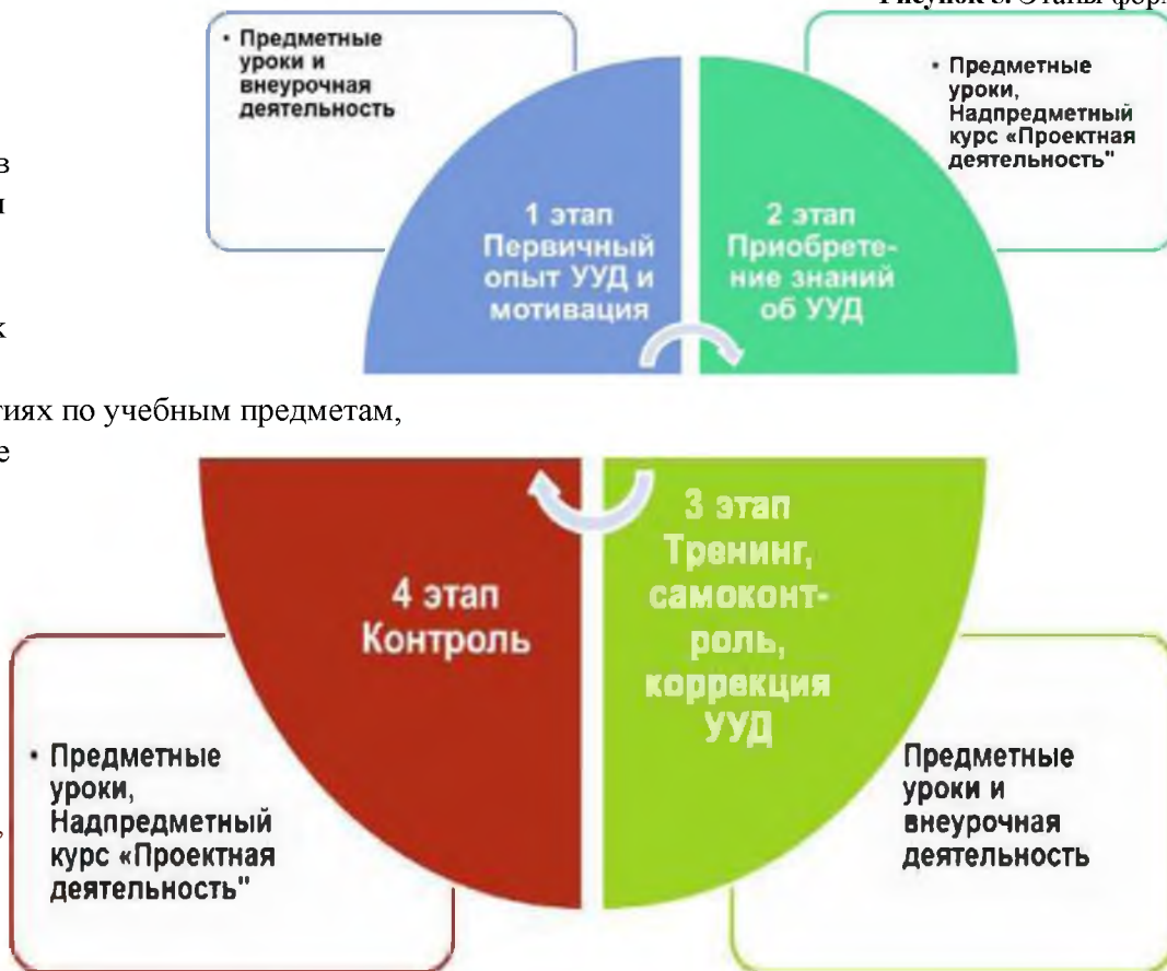
Рисунок 5. Этапы формирования